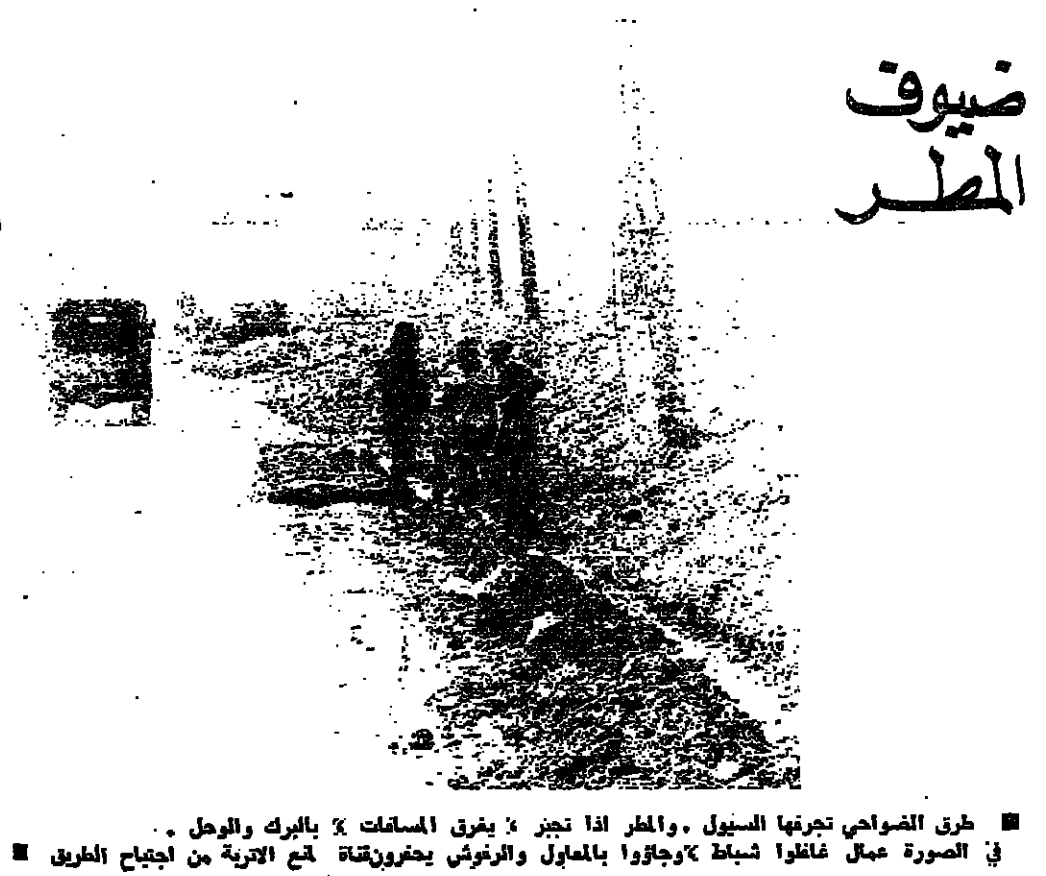
طرق الضواحي تجررها السيول . والمطر اذا تجر : يفرق المسامات % بالبرك والوطل في الصورة عمال غاطوا شباط % وجاوا بالممول والرغوش يحفرنقاة فتح الاترية من اجتناع الطريق